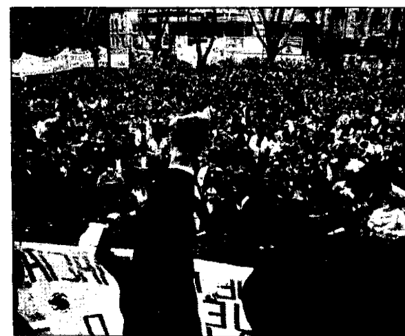
Sin incidentes en la de Bilbao.