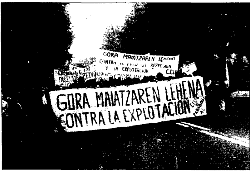
Al poco rato vendría la carga policial.