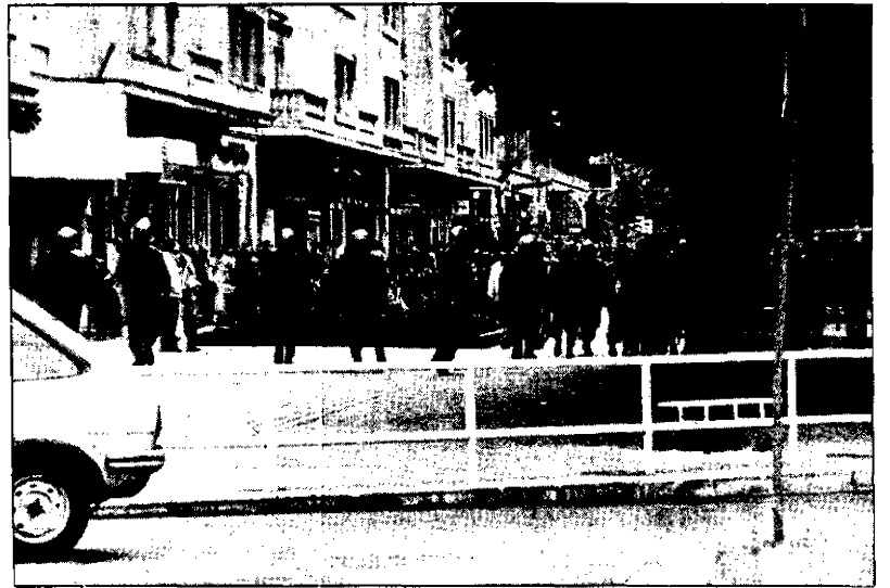
Una imagen excesivamente repetida ayer en Donostia.

A partir del primer incidente, en que muchos de los manifestantes disueltos no pudieron agruparse con el resto de la manifestación, la Avenida de la Libertad fue el cen-