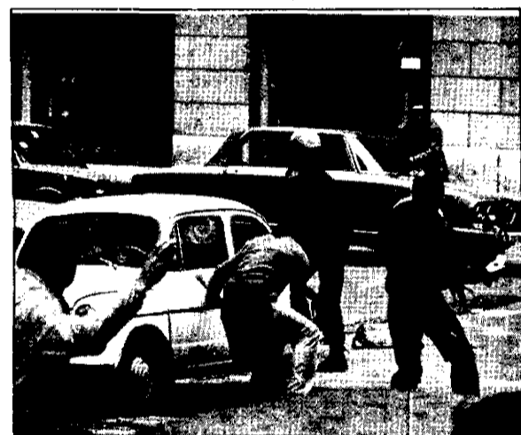
San Sebastián: dos momentos en que la Policía estuvo acorralada después de cargar contra los manifestantes.