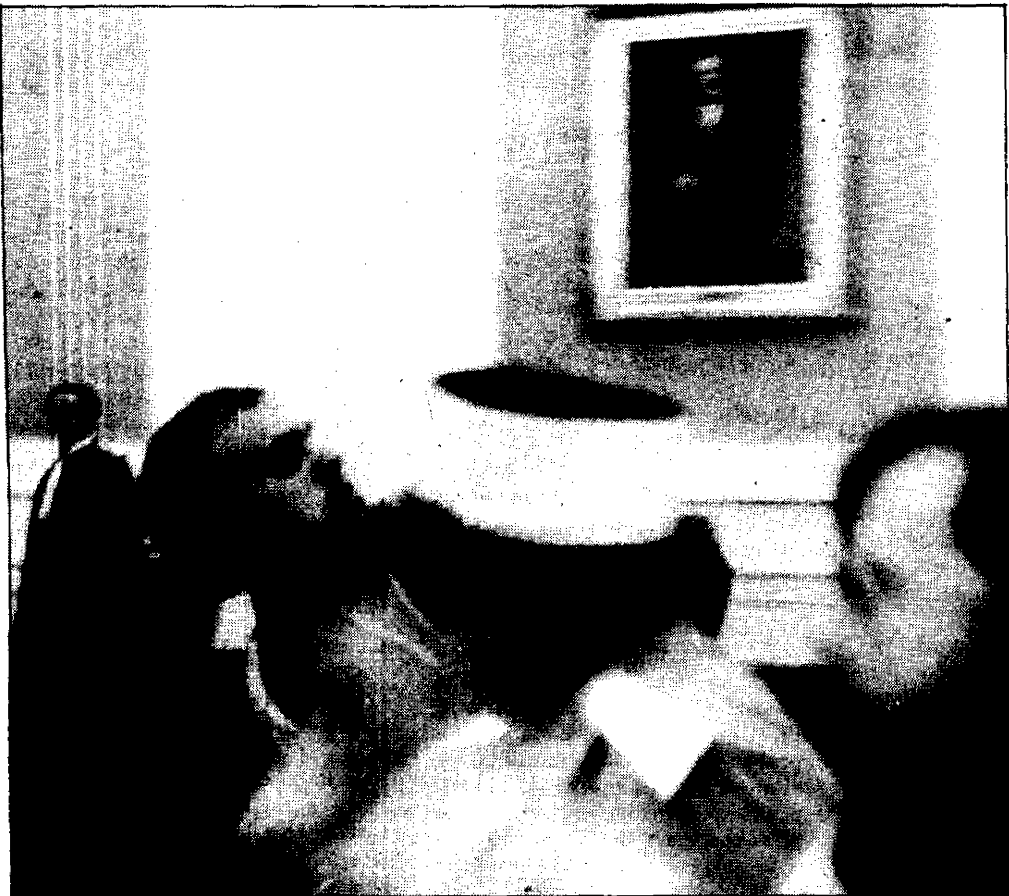
Lujanbio tuvo que ser desalojado violentamente de la sala del Tribunal de Pau