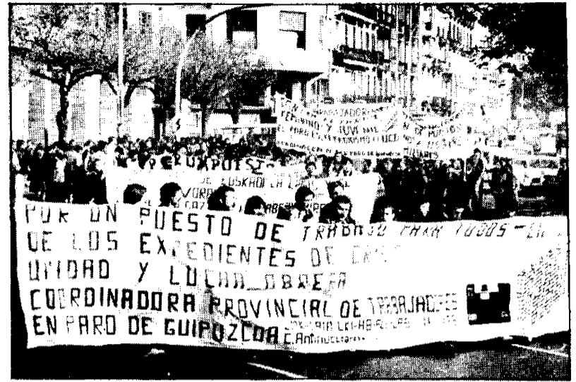
Mientras los trabajadores exigen puestos de trabajo fijos, el Gobierno sigue la pretensión patronal de fomentar la contratación temporal.

La contratación temporal estará sujeta a limitaciones en función de la plantilla fija con arreglo a la siguiente escala: 1) Plantilla de más de 1.000 trabajadores; el 10 por cien (antes el 5). 2) Entre 501 y mil trabajadores: el 15 por cien (antes el 10). 3) Entre 251 y 500 trabajadores: el 20 por cien (antes el 15). 4) Entre 51 trabajadores y 250: el 25 por cien (antes, entre 100 y 250, el 20 por cien). 5) Menos de 50 trabajadores: el 50 por cien, si bien se podrá llegar hasta el 100 por cien previa comunicación al INEM (antes, entre 50 y 100 trabajadores, el 25 por cien, y menos de 50 trabajadores, el 30 por ciento).