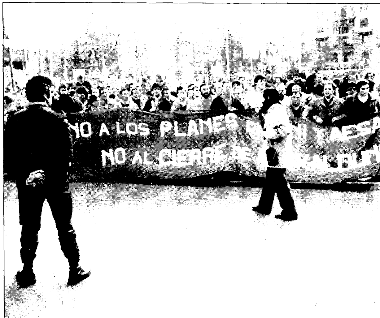
Los trabajadores de los astilleros vizcainos continúan movilizándose contra la reconversión naval.

Puestos alternativos: «Las nuevas inversiones deben ser públicas, no privadas, respondiendo a las necesidades de empleo en las diversas zonas y regiones, obteniendo así una auténtica rentabilidad social», según concluye la síntesis de la alternativa a la actual situación del sector naval elaborada por INTG, CAT y CSI.