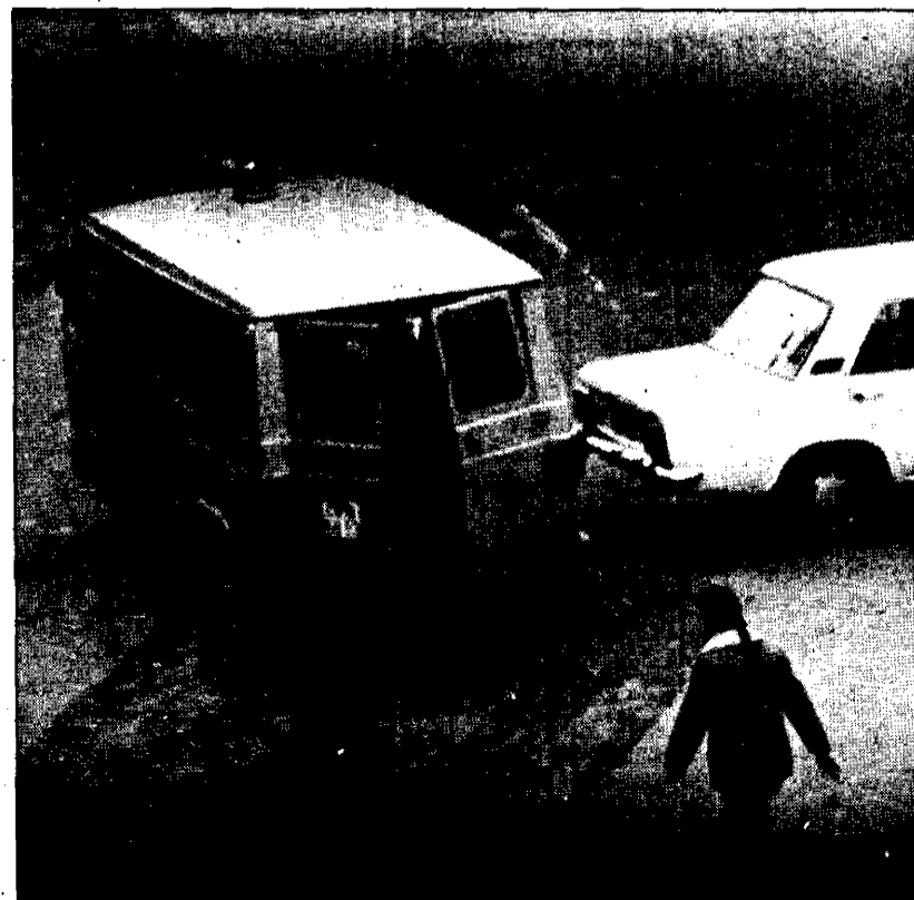
La protesta de esta joven alavesa por la detención de sus familiares sólo sirvió para ser también detenida.

Las carreras se prolongarían hasta casi las tres de la tarde, deteniendo la Policía a tres mujeres (abuela, madre y sobrina) en la zona de la calle San Francisco en el Casco Viejo, donde se habían colocado barricadas. Posteriormente fueron puestas en libertad. En algún momento la Policía denunció por el megáfono a la gente de las aceras que se apartase de la calle, porque "si no vamos a cargar contra todos ustedes" pidiendo que se colaborase circulando por otras zonas. Militantes de EMK enarbolaron una bandera del partido, en lo alto del monumento de la Independencia o Batalla de Vitoria en la plaza de la Virgen Blanca.