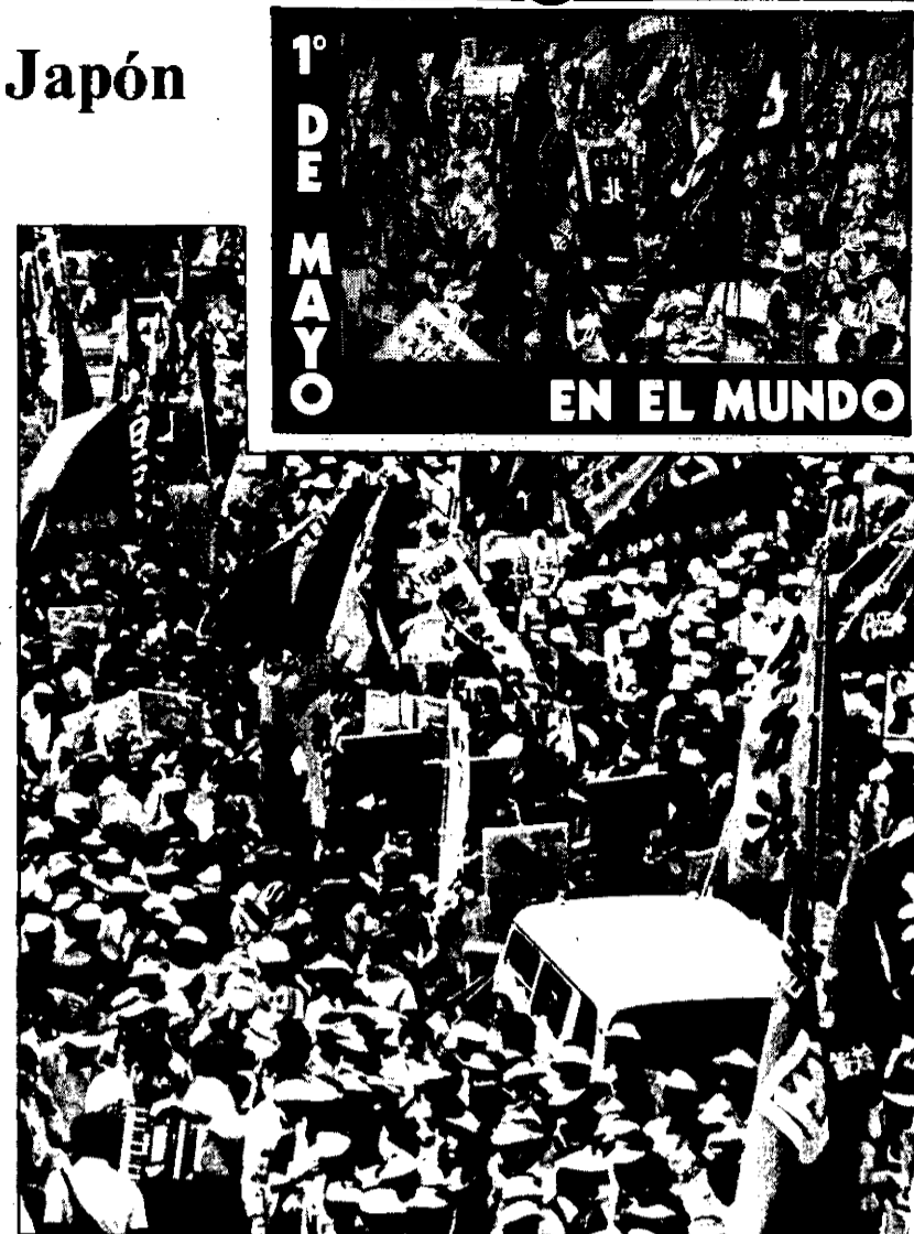
Una de las celebraciones en Tokio.