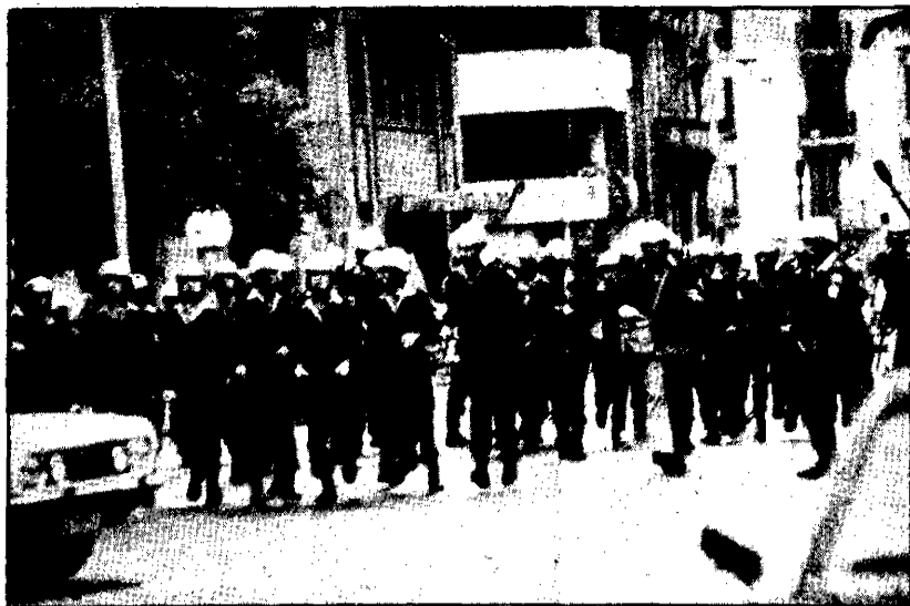
Las FOP durante una de sus cargas en Pamplona.