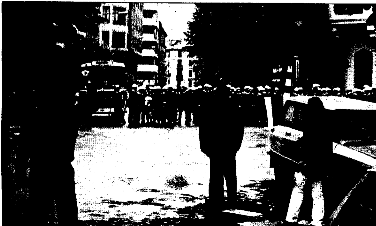
La actuación policial en Pamplona se produjo a los pocos minutos de formarse la manifestación.