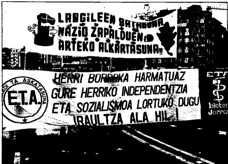
Esta pancarta fue el pretexto esgrimido por el gobernador civil de San Sebastián para justificar la represión policial.

El Primero de Mayo se celebró también en otras muchas partes del mundo sin particularidades de relieve. En la Europa Occidental las centrales sindicales de izquierda desfilaron en las principales capitales, agrupando a millares de personas y en la Europa Oriental se llevaron a cabo los tradicionales festejos con asistencia de las primeras personalidades políticas de cada país. En el resto del mundo la participación fue desigual, destacando la alcanzada en Japón, donde hubo una gran asistencia a las manifestaciones.