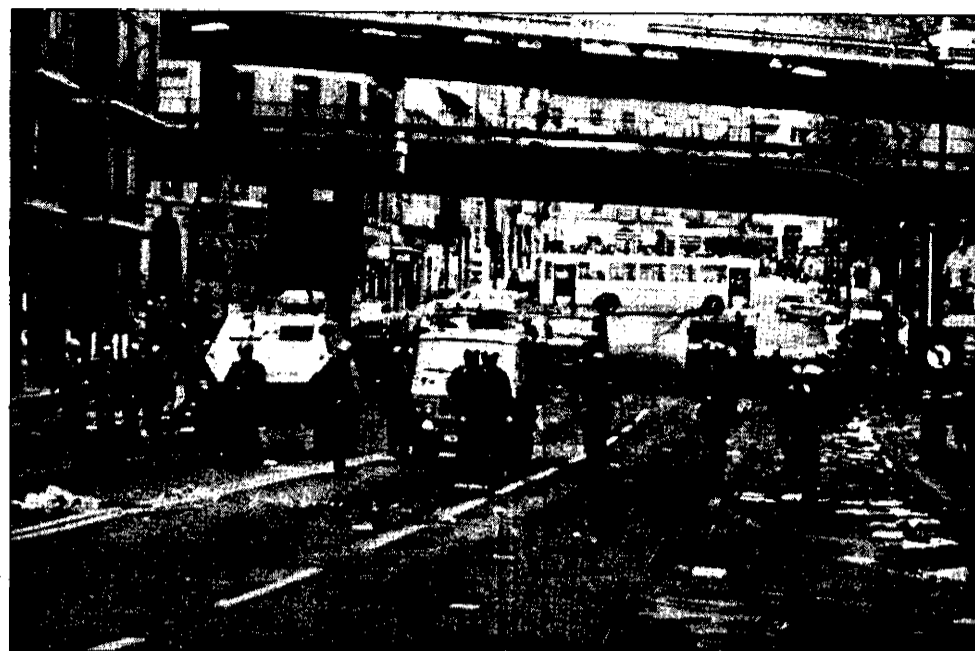
Después de las cargas, la policía ocupó la calle Autonomía.

El clima electoral le vino dado por el hecho de que, dentro de diez días, se celebrará la segunda vuelta de las elecciones presidenciales que, tras veintitrés años de permanencia de la derecha en el poder, pueden decidir un giro hacia opciones más socialistas. De hecho, todas las fuerzas políticas y sindicales de izquierda han llamado de modo unitario al voto del cambio, es decir, a votar a Mitterrand. La no participación del sindicato socialista CFDT — mayoritario en Iparralde — se debió a que esta central consideró que, más que una manifestación, la de Bayona iba a resultar más una procesión, por lo que la CFDT se limitó a conmemorar la fecha con un mitin-festival celebrado la víspera, centrándolo sobre las luchas laborales en las empresas locales.