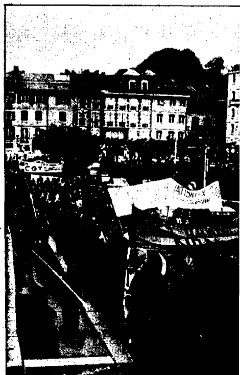
En Bayona se repitió el tradicional desfile del 1º de Mayo.

Previamente se produjeron momentos de tensión cuando pasaban los cortejos de CC.OO., ELA y UGT por el punto de concentración de LAB, y al corear un grupo de consignas de "Gora ETA (m)", "Burguesía kanpora" y "CCOO, UGT, sindicatos de UCD".