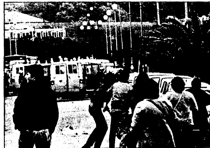
Momento en que la policía cargó contra los manifestantes de la izquierda abertzale en San Sebastián.