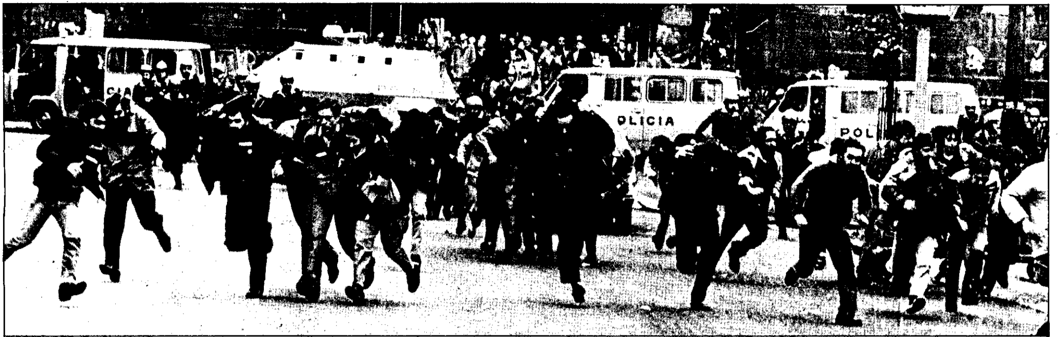
El Arenal bilbaino fue escenario de una de las cargas policiales.