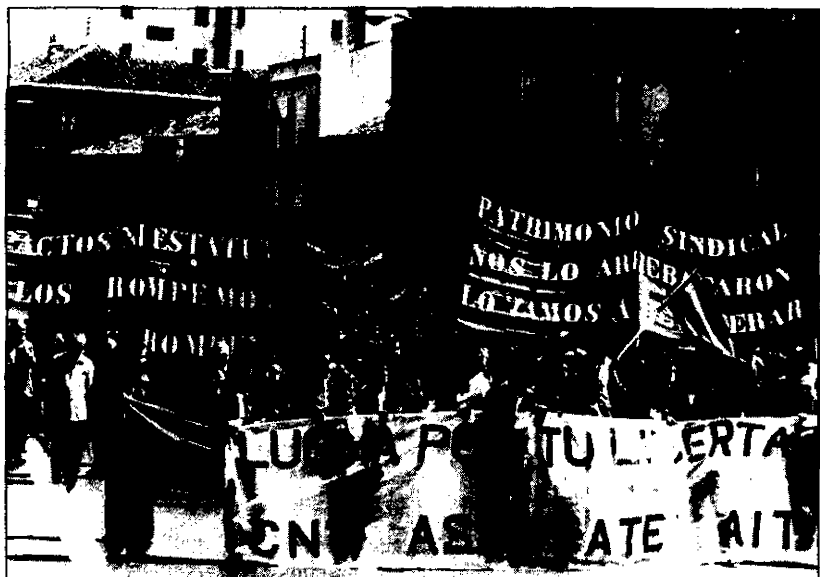
Cabeza de la manifestación de la CNT en Madrid.