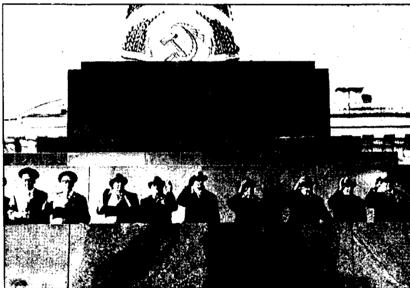
Los principales líderes soviéticos saludan desde el Mausoleo Lenin.

La manifestación, realizada en marcha combatiente, pasó durante horas por la popular Plaza de la Revolución, engalanda con banderas y grandes carteles referentes al acto y un gran retrato del comandante Che Guevara.