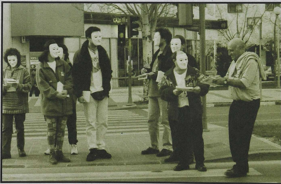
4 Istripuen milakoa Ikus ERANSKINA.

Hori frogatzen dute kontratu motaren araberako eginiko estatistikek, zeinek zera dierazten duten: Aldi Baterako Lan Enpresak legeztatu ziren urtean -1.994. an, hain zuzen-aldi baterako motaren batetan lan egiten duten langileek jasaten duten ezbeharraren tasak 4 zuen jorran, goranzko aldaketa nabarmen bat sortu zen. Harrez geroztik, lanpostu batetan lan-istripu bat izateko dagoen probabilitatea, etengabe igotzen dago.