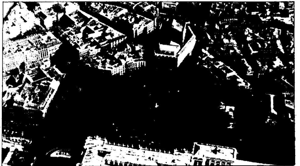
Aunque todavía no se ha podido verificar con exactitud el número de asistentes, lo cierto es que los "ultras" llenaron la Plaza de Oriente

Por la tarde del domingo, los ultras se hicieron fuertes en la "zona nacional" del barrio de Salamanca y colapsaron la circulación. Ha habido 23 detenidos puestos a disposición judicial, entre los que se encuentra el conocido ultraderechista barcelonés Alberto Royuela. (Páginas 10 y 11)