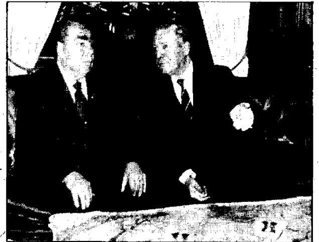
Schmidt eta Breznev mintzo dira, baina ezin dute elkar aditu, antza