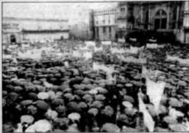
Bajo una fuerte lluvia, una panorámica de la concentración de los trabajadores gallegos en la Plaza del Obrador de Santiago.

Más de doscientos policías nacionales con cascos y material antidisturbios, municipales y refuerzos de la Guardia Civil, acordonaron prácticamente la capital gallega, completamente invadida por la llegada de los trabajadores de las plantas de Astano, Aacon, Vulcano, Freire, Barreras, Santo Domingo y empresas auxiliares. En concreto, de Ferrol acudieron cuatro trenes con 104