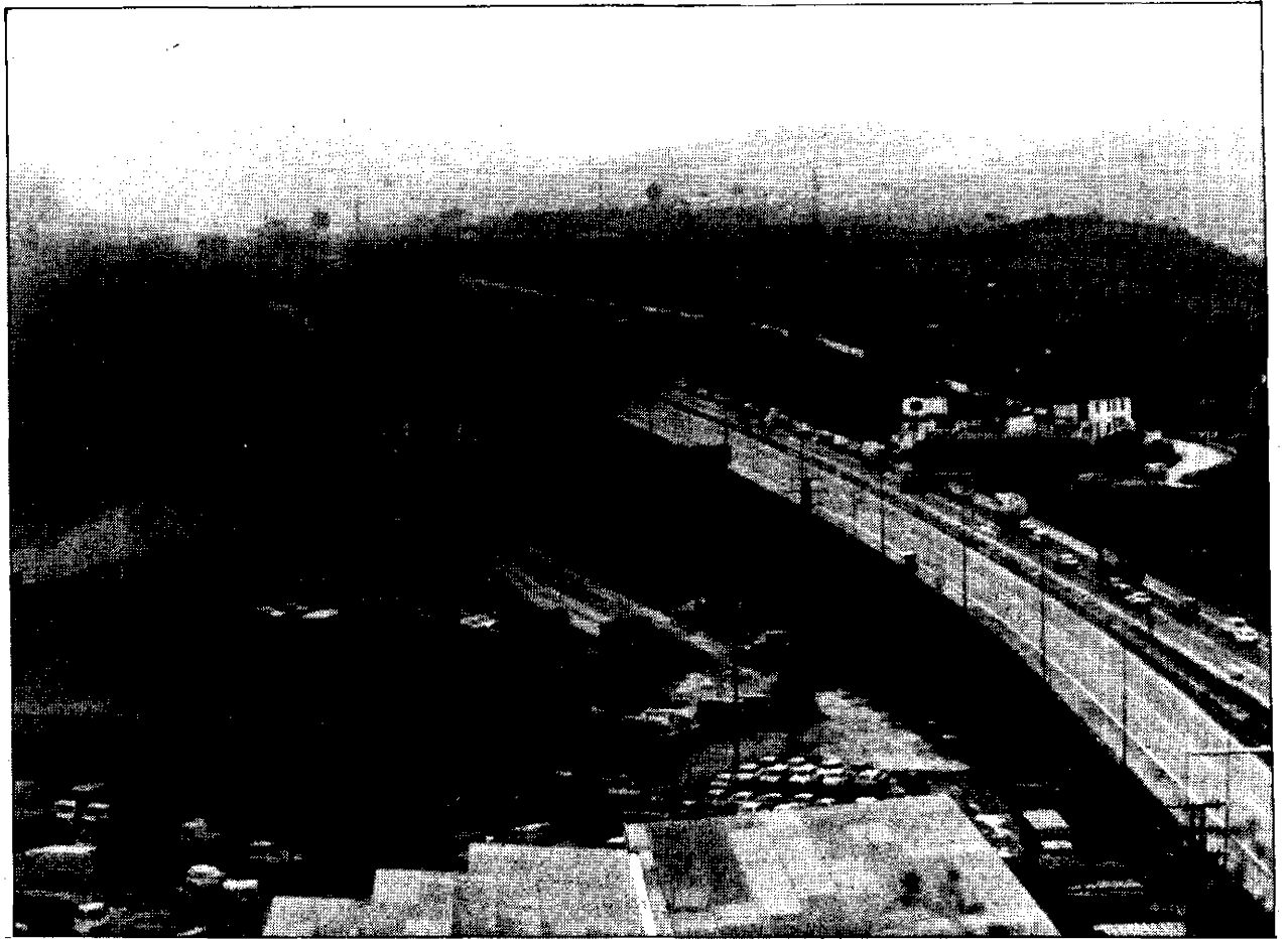
Los trabajadores de Fabrelec cortaron la autopista de San Sebastián-Bilbao con barricadas de fuego.

Finalmente, han convocado «una marcha a Madrid de todos los trabajadores del sector el próximo día 14 y, en su preparación la actividad de una delegación de cada zona durante los días 12 y 13 del corriente, a saber: Vigo, Ferrol, Euskadi, Asturias, Valencia, Andalucía, Cantabria con representación a acordar en cada zona o, en su defecto, con criterio proporcional».